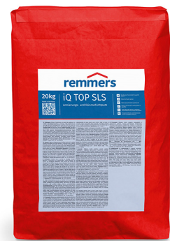
iQ TOP SLS art. 0230