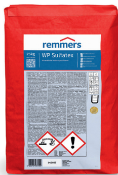
WP Sulfatex art. 0430