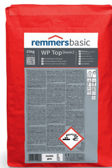
WP Top [basic] art. 0428